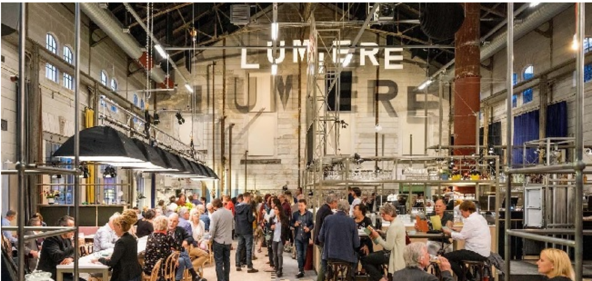
Restaurant Lumière is de jongste aanwinst van culinair Maastricht en na het eten meteen een filmpje pikken!

Ook VALKENBURG heeft het nodige te bieden, maar de keuze is een tandje minder dan in Maastricht.